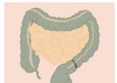
Voorbeeld oncologische resectie (PID dikke darmkanker isala.nl)

Sinds de introductie van het bevolkingsonderzoek in Nederland in 2014 wordt dikke darmkanker steeds vaker in een vroeg stadium opgespoord. Voor darmtumoren die in een vroeg stadium worden opgespoord, de zogenaamde “T1-tumoren” werd voorheen altijd dezelfde operatie uitgevoerd als bij tumoren die in een verder stadium zijn. Bij deze grote operatie, ook wel een “oncologische resectie” genoemd, wordt een deel van de dikke darm verwijderd en worden de uiteinden meestal weer aan elkaar gemaakt. Darmkanker