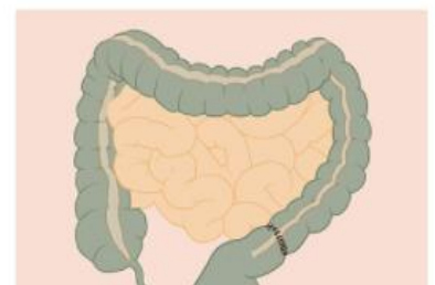
Voorbeeld oncologische resectie (PID dikke darmkanker isala.nl)